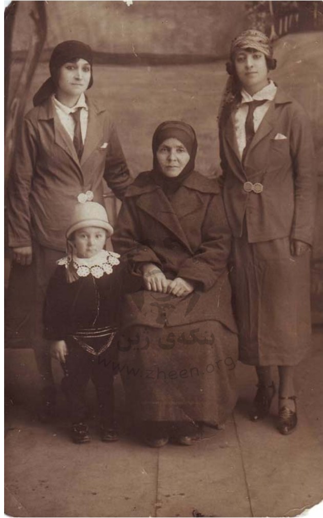
له راسته وه: یه شار خانم، عیفته خانمی دایکی یه شار، خانم سدیقه براژنی یه شار و منداله که ی- نیسانی ۱۹۲۶، ئه رزپووم