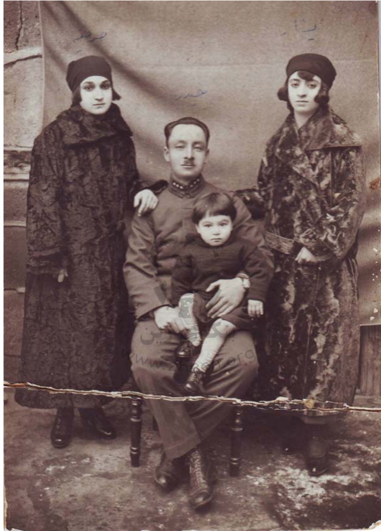
له چه پهوه: یه شار خانم، هیدر بهگ و مندالهکهی، خانم سه دیکه ژنی هیدر