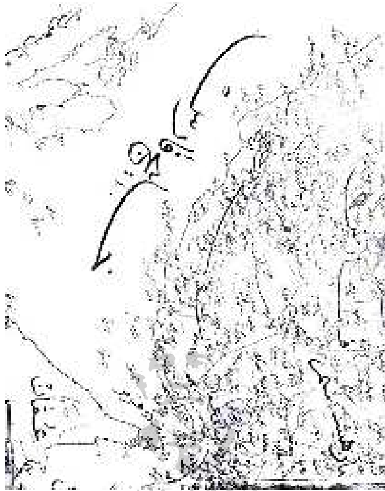
دوورگه ئى ھەنگام لەناو تەنگەلانى ھورمز